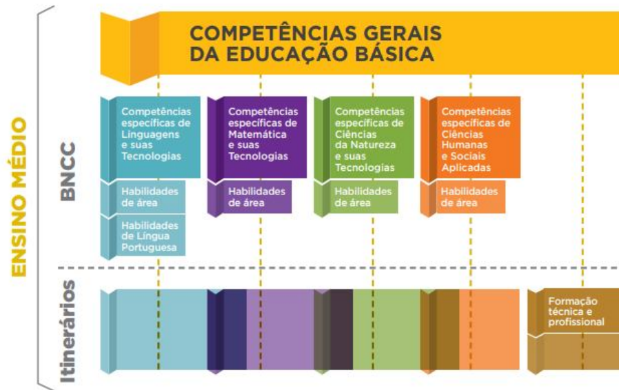
Figura 2. Competências Gerais da Educação Básica